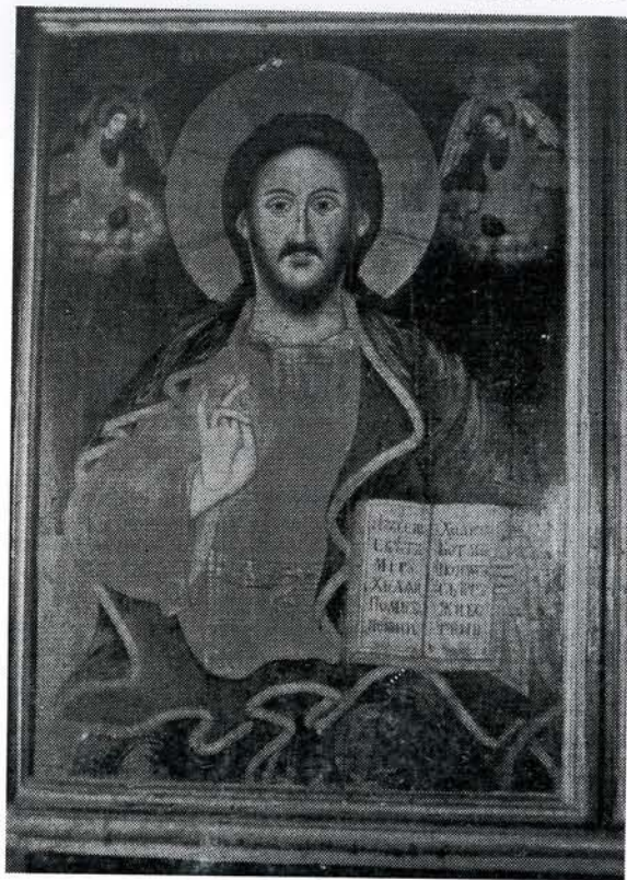
Христ који благосиља, пресѐйна икона са иконостаса у цркви брвнари у Лозовику, 1831-1832. год.