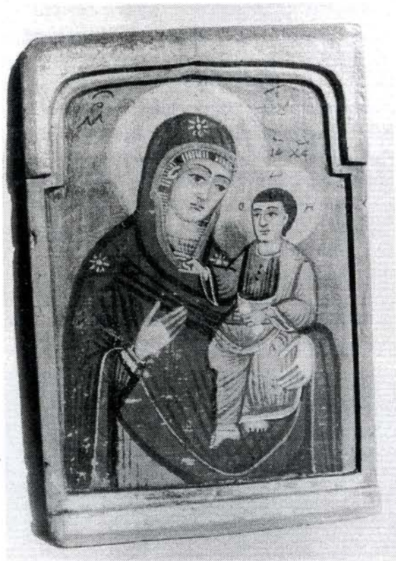
Богородица са Христом, икона из цркве брвнаре у Крњеву, почетак XIX века

На свим крњевачким иконама, односно на средњим деловима триптиха насликани су ликови Богородице са малим Христом. На крилима триптиха насликани су ликови светитеља чији су култови били нарочито неговани у народу.