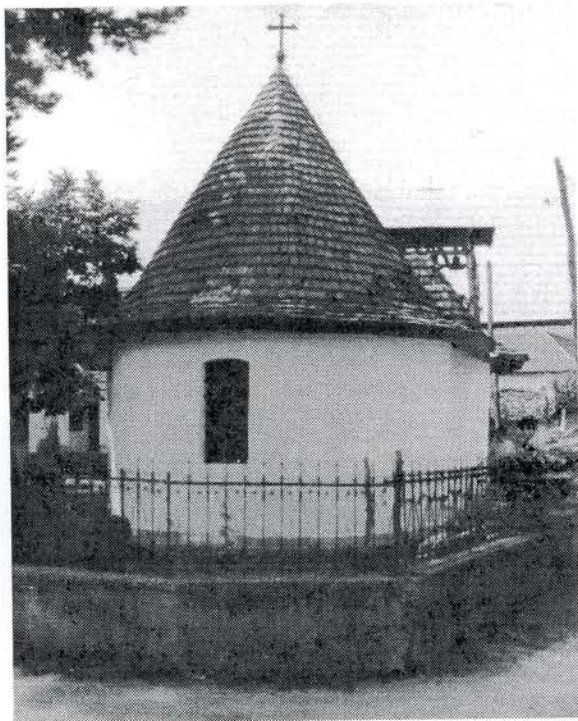
Црква Св. Николе у Кисилеву, 1826. год.

на брвнаре у бондручној конструкцији су црква у селу Раброву из 1817. године, црква у Кисилеву из 1826, црква у Ореовици из 1825. и црква у Раму из 1831. го-