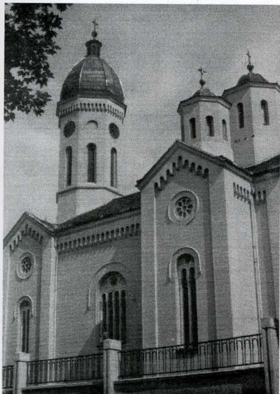
Црква Св. Преображења у Смедеревској Паланци, 1892-1894. год.

мењен је код цркве у Смедеревској Паланци. Црква је подигнута као једнобродна грађевина засведена полубличастим сводом са једном полукружном олтарском апсидом на источној страни и правоугаоним певницама изнад којих се уздижу два мала полигонална кубета. Над источним делом цркве уздиже се још једно осмострано кубе, које је у односу на архитектонску масу грађевине веома мало. Изнад западног дела цркве уздиже се витки осмострани звоник. У обради фасада цркве присутни су декоративни елементи преузети из средњовековне традиције: аркадни фриз, бифоре и трифоре, розете.