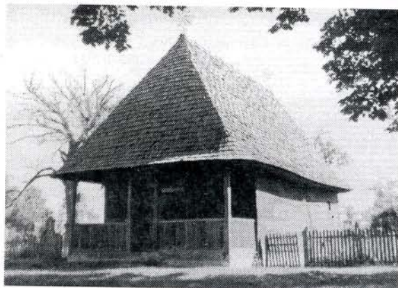
Црква брвнара у Лозовику, 1830/2. год.

У почетку Милошеве владавине на овој територији и даље се граде цркве брвнаре. Хронолошки редослед цркава брвнара је следећи: Црква манастира Покајнице (1818), црква Св. Тројице у Селевцу (1827), црква брвнара на гробљу у Смедеревској Паланци (1830), и црква брвнара у Лозовику (1830/2).