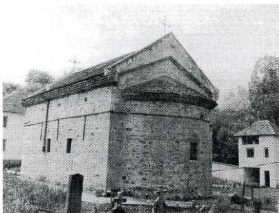
Црква манастира Рукомије, 1825. год.

Кнез Милош Обреновић подигао је и данашњу цркву манастира Рукомије 1825. године, на месту старије цркве коју су Турци 1813. године срушили до темеља 6 . Црква манастира Рукомије представља једнобродну грађевину правоугаоне основе без кубета, са једном полукружном олтарском апсидом на источној страни. Унутрашњост је засведена подужним полуобличастим сводом који се ослања на бочне зидове грађевине. Зидана је ломљеним каменом. На цркви се истичу лепо обрађени портали са каменим оквирима.