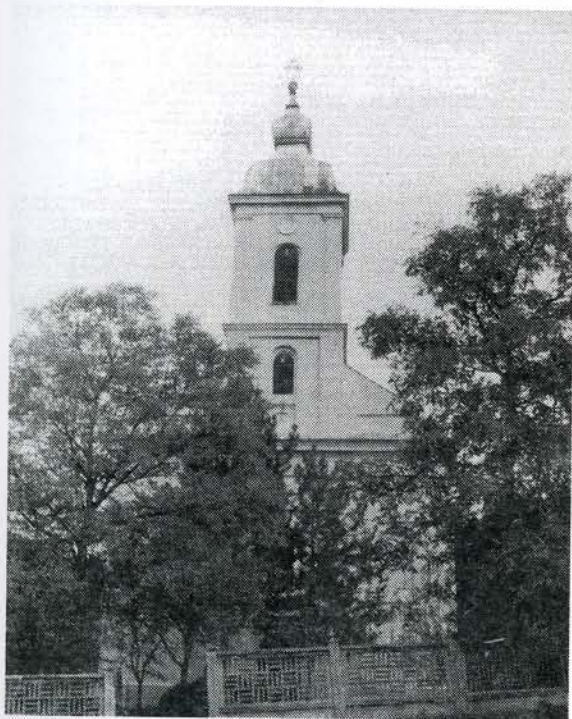
Нова црква у Четережу, 1844. год.

Најрепрезентативнија и највећа од набројаних цркава је нова црква у Четережу. Она је подигнута као једнобродна