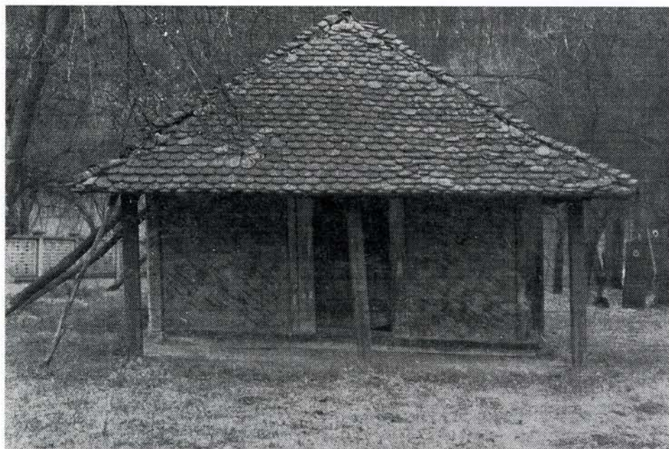
Сл. 1. Западни изглед цркве брвнаре

Падом Деспотовине под Турке пореметиле су се политичке, друштвене и економске прилике у земљи, тако да српски народ није био у стању да гради монументалне сакралне грађевине, већ се морао задовољити градњом малих цркава-брвнара јер је она тада била најлогичнија врста богомоље. Цркве брвнаре грађене су скромно и скривено да се Турци не би изазивали. Подизане су скромним средствима, грађом из непосредне околине, малих размера, без кубета које би одавало црквено обележје грађевине.