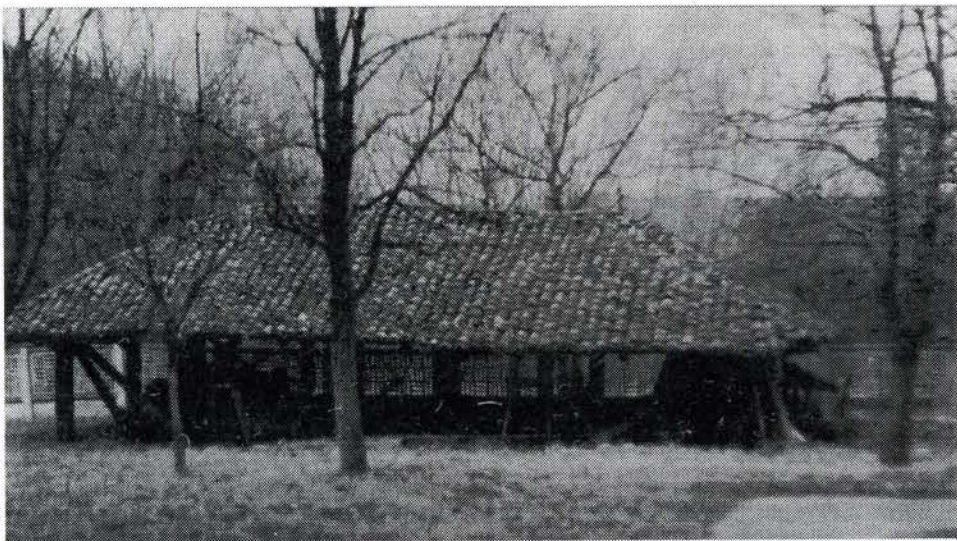
Сл. 3. Лужни изглед собрашице

Кровна конструкција је од рогова који се у горњој зони ослањају на слемењачу а у доњој на поклопницу и венчаницу. Стреха крова је доста велика и налази се у истој равни крова. На крову се налазе два гвоздена крста. Због великог оптерећења тешког кровног покривача стубови собрашице су утонули у земљу, тако да садашња висина стрехе на појединим местима износи само 1,4 м. Због тако великог слегања собрашице нису видљиви ни веза стуба и косника у доњој зони. Извршеним ископавањем на тим местима установљено је да се веза стуба и косника налази на око 20 цм испод нивоа земље, а ни на дубини од 30 цм испод нивоа земље нису пронађени никакви трагови темеља.