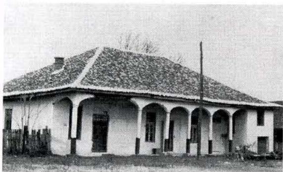
Сл. 3. Механа Животића у Орљево