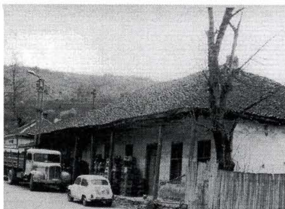
Сл. 5. Механа у Лазници