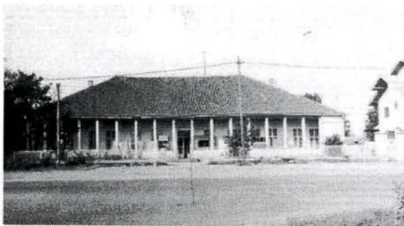
Сл. 1. Зграда механе породице Штерић

У селу Осипаоници на раскрсници путева који повезују Смедерево, Велику Плану и Пожаревац у другој половини 19. века саграђена је механа познатија у овом крају као "Кафана Штерића". Назив је добила по фамилији Штерића који су били власници ове механе и који су то и данас.