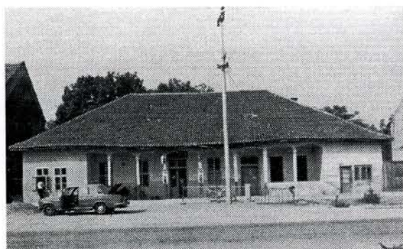
Сл. 2. Механа породице Младеновић у Сараорцима

Зграда механе у Сараорцима лоцирана је у центру, покрај пута који повезује Смедерево и Велику Плану. Саграђена је у другој половини 19. века. Правоугаоне је основе, димензија 30 x 15 метара. Темељи су од опеке старог формата на које належу хрстове греде темењаче. Зидови су бондручне конструкције са испуном од плетара, који је омалтерисан и прекречен. Кров је четвороводни са покривачем од ћерамиде.